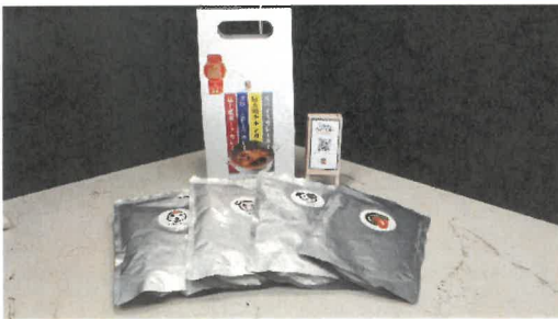
① 4種お徳用パック(ビーフ・富士桜ポーク・信玄鶏・スパイスカレー) 2,000円税込