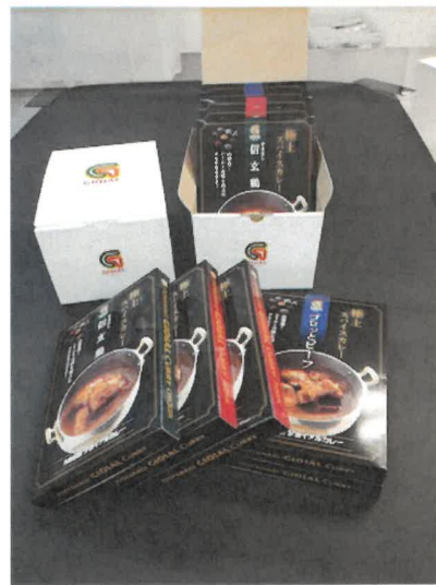
② 3種 5個入 GIFT5(ビーフ 2・富士桜ポーク 2・信玄鶏 1) 3,240円税込