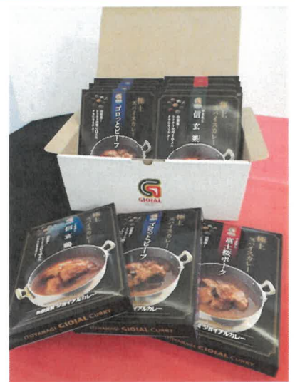
③ 3種 10個入 GIFT10(ビーフ 4・富士桜ポーク 3・信玄鶏 3) 6,000円税込

※株式会社ジョイアルファクトリー 山梨県笛吹市川中島 1607-172 TEL055-263-9911 FAX055-263-9912